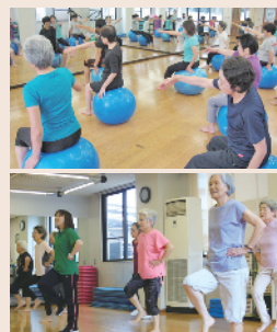
▲ボール体操と音楽に合わせた健康体操