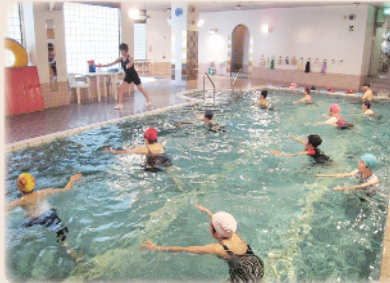
▲アクアピクスの様子